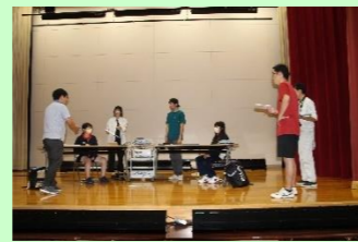
(写真：演劇練習風景)