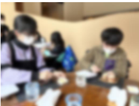
【スキー授業後のテーブルマナー講座】