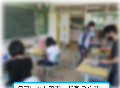
タブレットでカードをつくり、 情報交流する高学年

どう操作したら自分の使いたいようにできるのかまだまだ勉強がたりません。とにかく遊び感覚でどんどん使っていかなければ授業で使いこなすことはできないでしょう。「おかげにしないで、使う」ことをモットーにまずは慣れ親しみ、子供たちと一緒に試行錯誤しながら使っていきたいと思います。これからの教師に求められる能力には、「ICT（情報通信技術）を活用した授業づくりをする能力」も新たに付け加えられていますから、子供たちに負けずに勉強をしなければなりません。このように6月は情報端末との出会いの月でもありました。