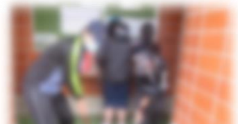
R2の観光トイレ清掃の様子

2年前の4月に着任してから、「来年こそは」という言葉を随所に使ってきました。コロナ禍が収束することを願っていたのですが、2年たってもこのような状況であるとは想像していませんでした。運動会や修学旅行の延期が2年も続き、観光トイレ清掃については今年度1度も実施していません。一方でワクチン接種が進んだり、処方薬が開発されたりするなど安心材料は増えてきました。「3度目の正直」となりますが、「来年こそは、多くの人が集える学校になってほしい!」と願います。長い歴史の幕を閉じる布礼別小学校で学んだ人々が伝統や思い出を語る場として、いつでも足をお運びいただける学校であってほしいのです。先日「学校運営協議会(CS)」が開かれ、委員の方からは、「地域住民から子供たちに布礼別小学校の話をする機会が、来年こそ必要ではないか?」というご意見をいただきました。本当にその通りであると思います。この状況が一日でも早く好転し、子供たちが多くの人々と織りなす、彩り豊かな学びが実現することを強く願っています。