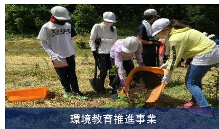
環境教育推進事業

本市の豊かな山林や水系、美しい農村景観などの自然環境は、市民の生活と深く結びついており、さらに観光や移住・定住等の関係人口の創出においても本市の大きな魅力の一つとなっています。こうした豊かな自然を100年後の未来へ繋ぐため、低炭素・循環・自然共生などの各分野における多様な保全活動を進めるとともに、自然教育の推進などを通して市民の環境意識の醸成を図ります。