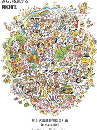
第6次富良野市総合計画 【前期基本計画】 Furano City Master Plan