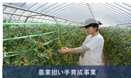
農業担い手育成事業

新規就農システムの構築、中小企業者等への店舗改修や家賃への補助、地元農産物等の加工品への認定制度、地域DMO事業の活性化など、地域内産業の付加価値を高めることにより、市民の所得の向上や新しい仕事の創出につなげるとともに、新たに就農や起業を考えている人へのチャレンジを支援いたします。