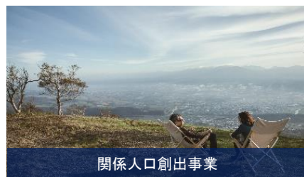
関係人口創出事業

社会的ニーズの多様化・複雑化に対応した新たなマッチングシステムの構築、地域内ブランド力向上と広域プロモーションによる本市の価値を高める取組、テレワーク受入環境の整備、移住ワンストップ窓口・移住促進情報サイトの充実など、人・情報・もの・カネ・場所などのマッチングを促進し、個人や地域の課題解決や新たな企業間取引や雇用促進、将来的な移住促進などに繋がります。