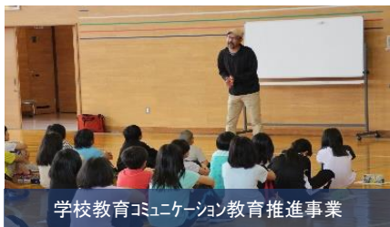
学校教育コミュニケーション教育推進事業

デジタルを活用した子育て支援の視える化、待機児童の解消・子育て世代への負担軽減等により、地域全体で安心して子育てできる環境を整備いたします。また、富良野でしかできない「体験プログラム・イベント」を通して郷土愛を醸成し、市民のまちづくりのアイデアの創出や交流活動の広がりから地域活性化を図る事業を展開いたします。