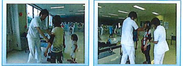
高齢者体験の感想 (60代女性) 「体が重く、歩きづらく、目も全体が白っぽく見えて想像以上だわ・・・」

展示 「我が校の歴史」 開校 23 年目を迎えました。卒業生は今春 3 月で 637 名です。富良野圏域、北海道内で活躍しています。