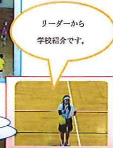
リーダーから学校紹介です。