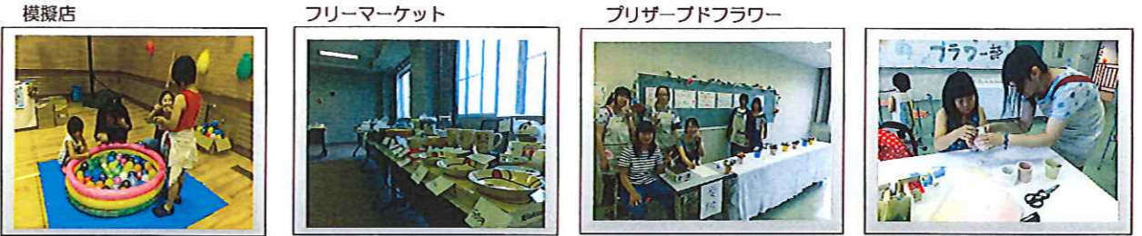
ヨーヨー釣りが大人気!! 地域の皆様!ご協力ありがとうございます。ほぼ完売。 「永遠の魔法の花」の販売と丁寧な指導のもと作成を体験。