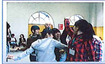
講演「人間関係づくり」