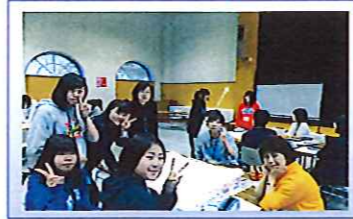
グループワーク「理想の看護師になるために」