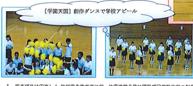
【学園天国】創作ダンスで学校アピール

1 審査項目は①楽しく、笑顔②身体表現に統一性③演技全体に躍動感④演技内容の創意工夫でした。