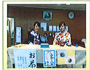
お茶 抹茶と和菓子でおもてなし