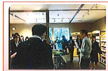
共済農場アンパンマンショップ