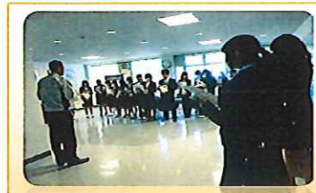
生涯学習センター