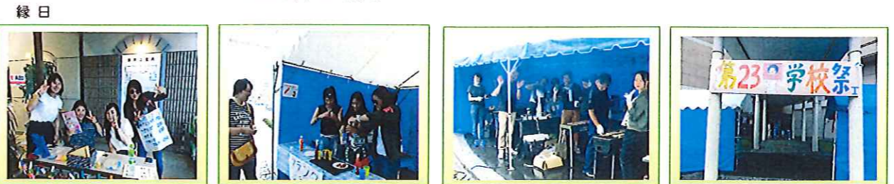
メニュー:かき氷 やきそば フランクフルト やきとり 炭火で焼いた「やきそば」、「やきとり」は例年どおり。★★★ 雨の中、市民の皆様、来校ありがとうございます。