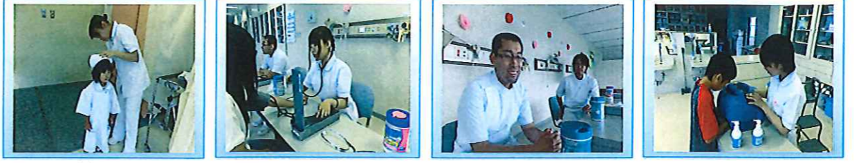
「わたし看護師になりました!」 「血圧測定」技術は合格 体調はいかがですか? 手洗いはできたかな?