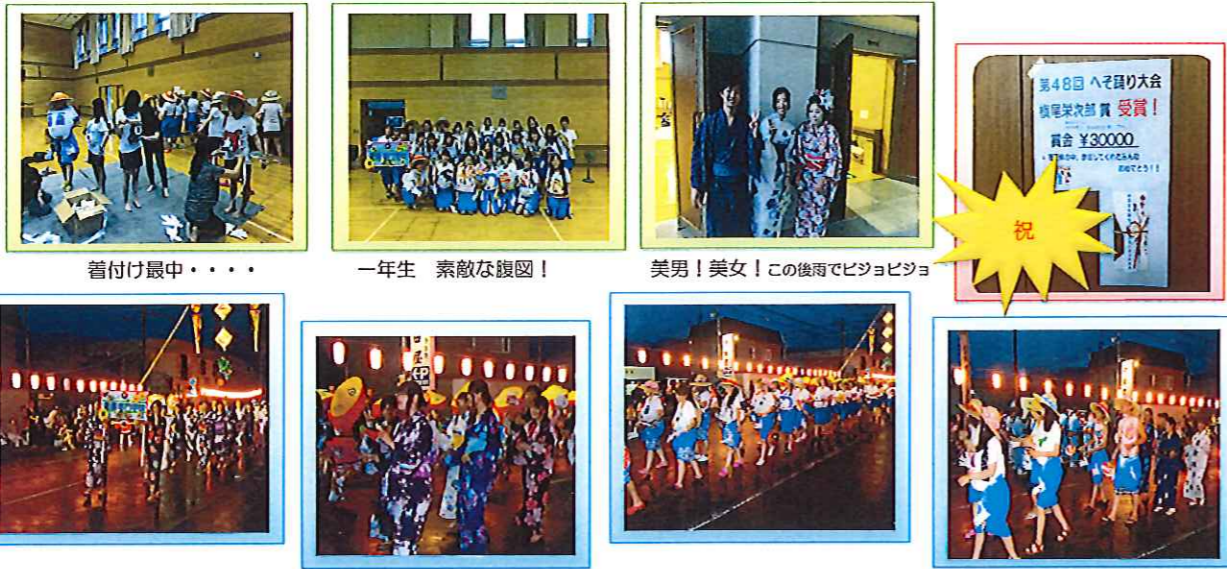
ハアー まんなか まんなかの どまんなかヨ おらがふらので 見せたいものは 蝦夷のまんなかの 出せそ石 イイジャナイカ イイジャナイカ イイジャナイカ