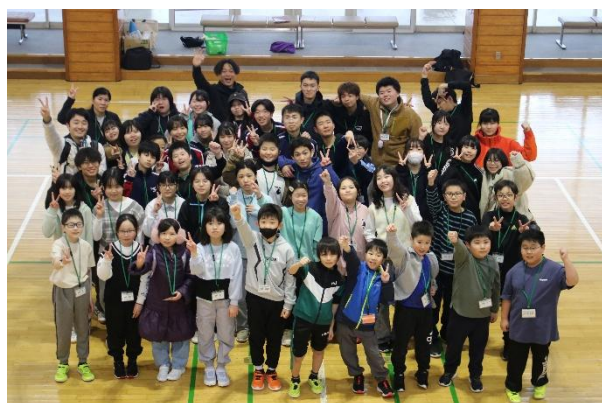
◇リーダー研修会<冬季> 令和8年3月20日～22日 国立日高青少年自然の家◇