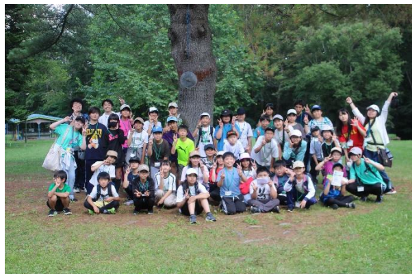
◇リーダー研修会<前期> 令和7年8月2日～3日 山部自然公園 太陽の里キャンプ場◇