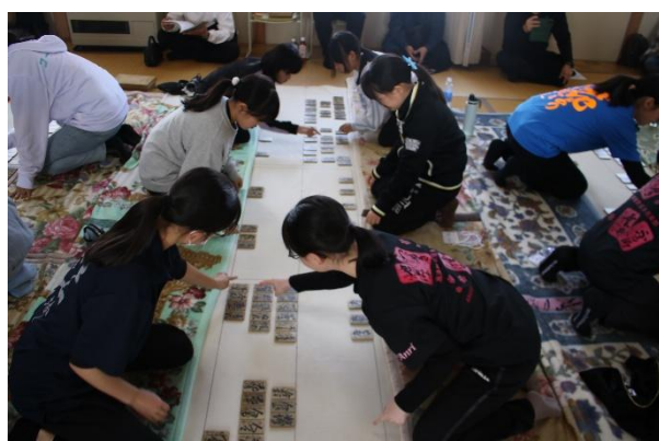
◇富良野沿線子ども歌留多交流会 令和8年3月15日 富良野市 大宝寺◇