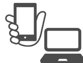
いつでも本の予約OK