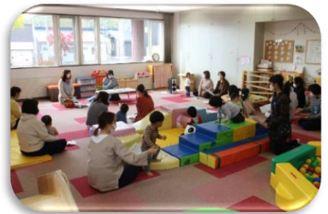
家庭教育セミナー