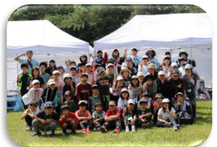
富良野市子ども会リーダー研修会