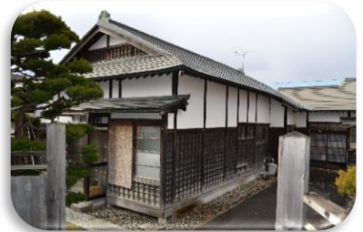
国登録有形文化財「島田家住宅主屋」