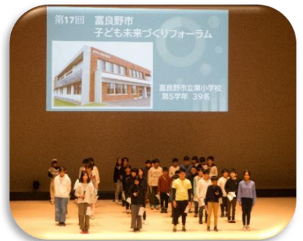
子ども未来づくりフォーラム