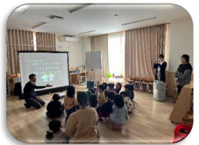
幼稚園への小学校先生訪問