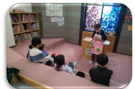
ボランティアとの協働による行事風景