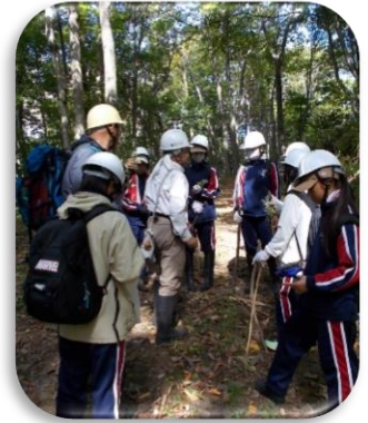
森林学習プログラム