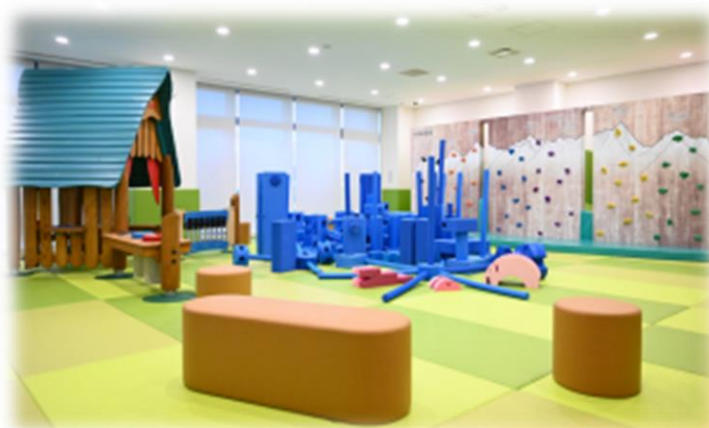
富良野市複合庁舎1階の幼児向け屋内遊具施設「へそキッズランド」

●保護者の育児不安、ひとり親の自立や就業などに対する支援の相談窓口を引き続き設置するとともに、関係部署や専門機関と連携し、情報の共有と共通理解により、課題解決を図ってまいります。