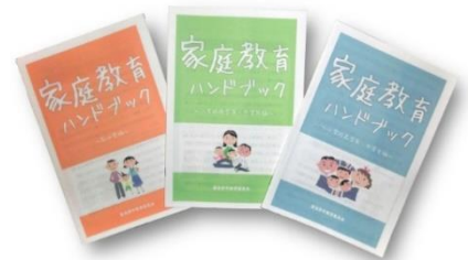
家庭教育ハンドブック