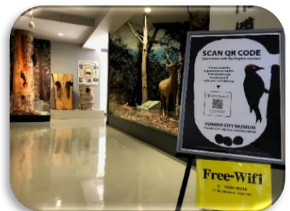
常設展示の英語版デジタル解説