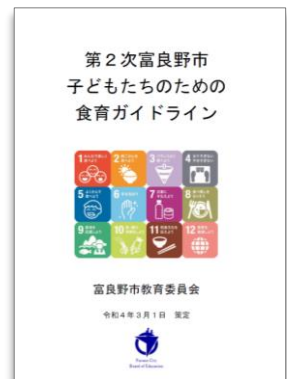
第2次食育ガイドライン