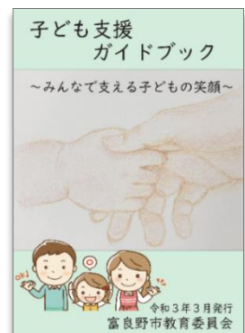
保護者向けガイドブック