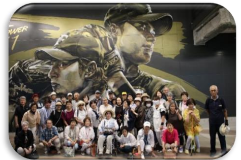
ことぶき大学（研修旅行）