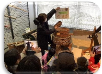
博物館常設展示の案内・解説