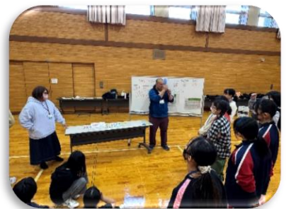
イングリッシュキャンプ