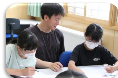
C S 地域連携事業 東っ子わくわくタイム (長期休業中の学習・生活習慣サポート)