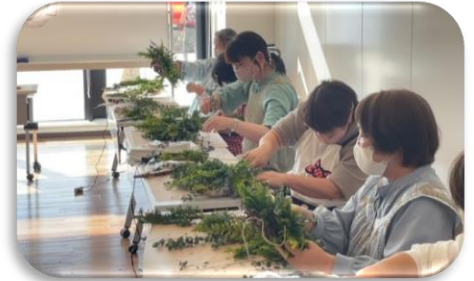
ふらの市民講座 ふれあい講座