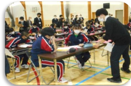
小中高合同研修会による互見授業