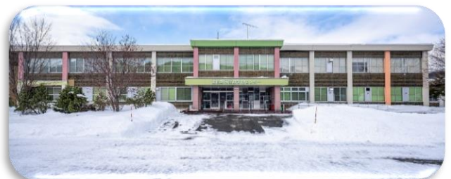
生涯学習センター