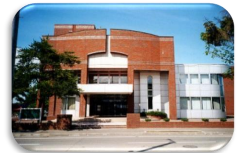
市立富良野図書館・中央公民館