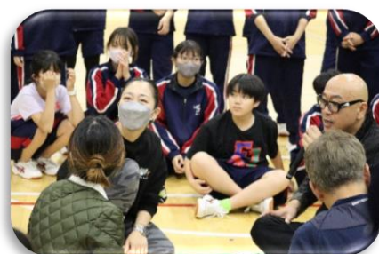
コミュニケーションワークショップ