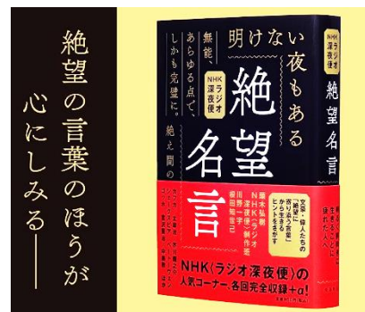
この本ではないかもしれませんが。

表題の書籍を求めるため書店に伺ったが、在庫がなく取り寄せと成った。今、手元に置き時間を割いて興味深い部分を判読(文章を理解するのに時間の掛かる自分が居る為)している。