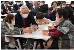
新入学生歓迎会に参加する学生さん