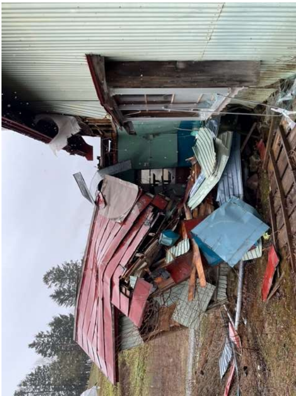
外壁の剥落及び屋根ぶき材の状況①