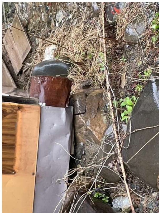
基礎状況 (玉石) ②