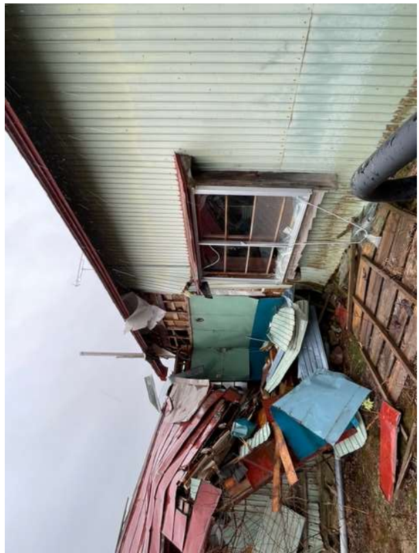
外壁の剥落及び屋根ぶき材の状況②