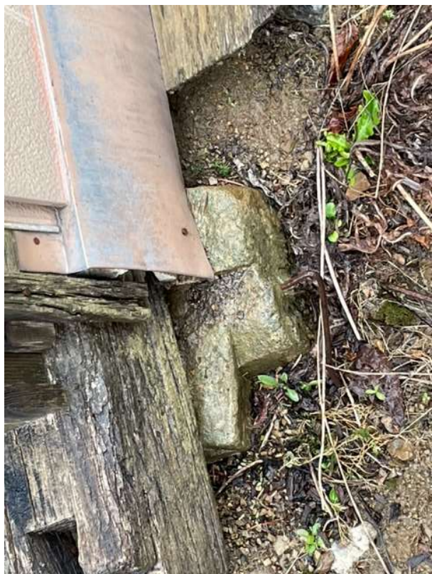
基礎状況 (玉石) ①