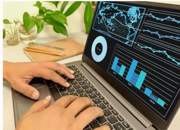
Oracle Analytics Cloudを活用 (画面はイメージです)