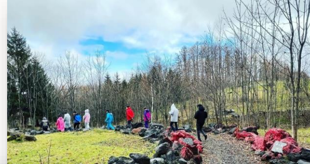
*フィールドワークの様子