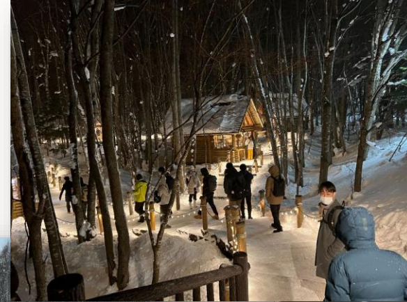
*フィールドワークの様子