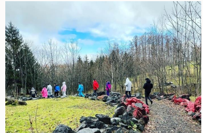
富良野市内の自然塾を視察・体験する学生