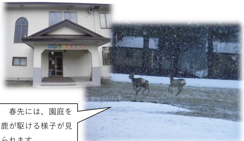
春先には、園庭を鹿が駆ける様子が見られます。