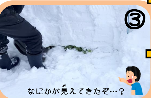
③ なにかが見えてきたぞ...？