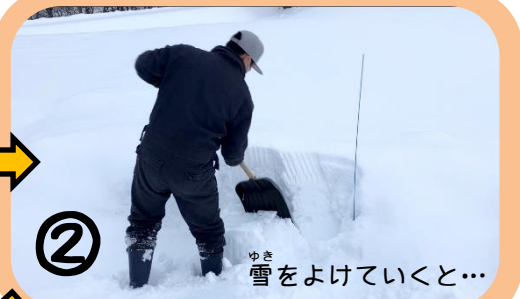
② 雪をよけていくと...