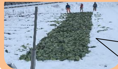
写真のキャベツはだいたい4トンくらいあるそうです！