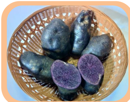
【紫】シャドークイーン