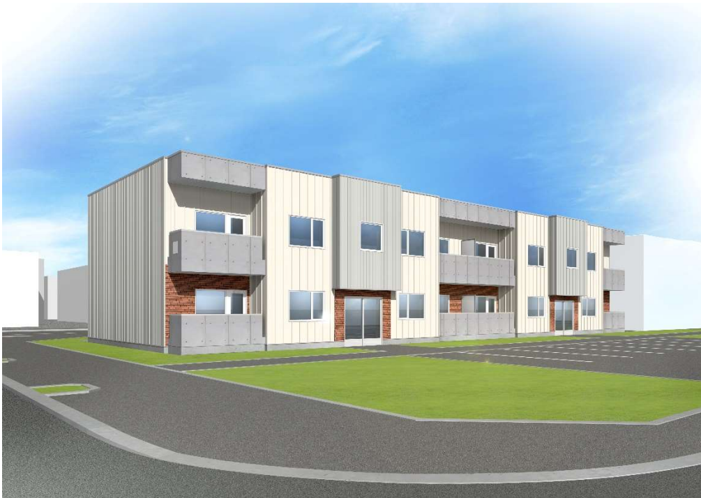
北麻町団地完成予想図