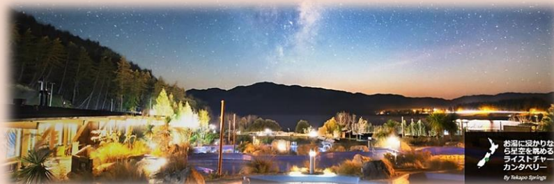
お湯に浸かりながら星空を眺める、タカポ・スプリングス