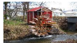
白鳥川小水力発電施設

市内の白鳥川に、企業・住民・行政が一体となって小型の水車を設置して発電し、自然エネルギーとして利用されています。