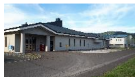
環境衛生センター （生ごみ堆肥化）