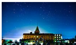
ホテルナトゥールヴァルト 富良野