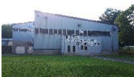
リサイクルセンター （固形燃料化）