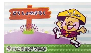
どくしょのきろく