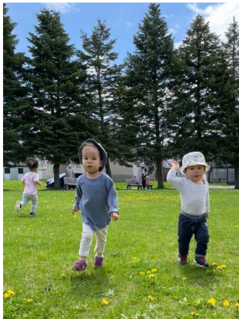
はらっぱでかけっこ！