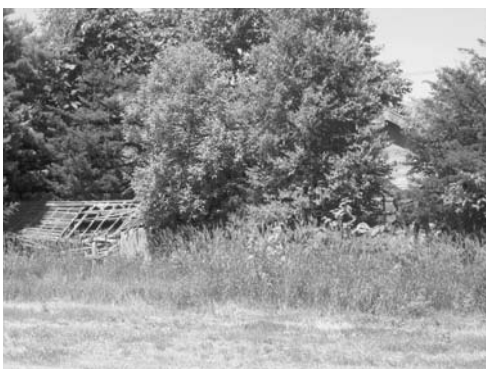
環境悪化を招く空き家