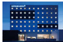
FURANO NATULUX HOTEL