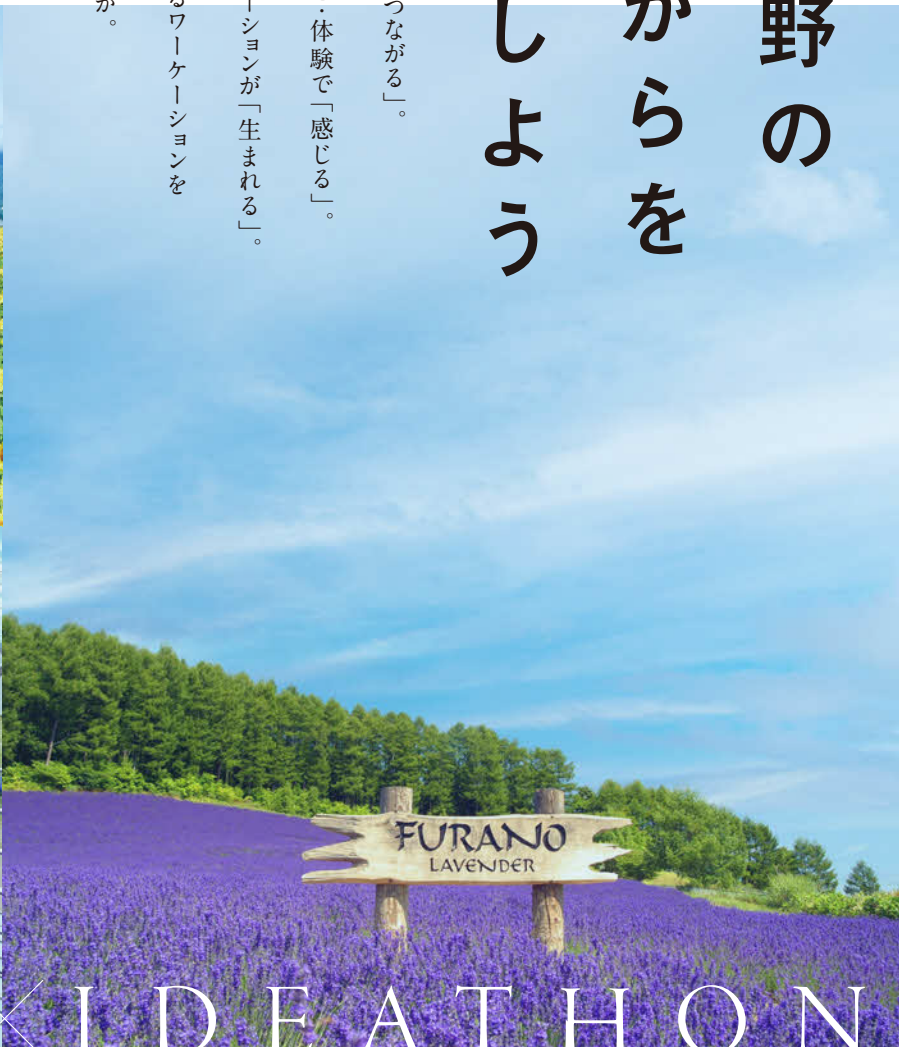
※写真は全てイメージです。