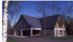
ふらのチーズ工房

ぶどうヶ丘に並んだ赤い屋根。ふらのワインの製造工程、熟成庫の見学、ワインの試飲などができます。