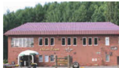
ふらのワイン工場

ぶどうヶ丘に並んだ赤い屋根。ふらのワインの製造工程、熟成庫の見学、ワインの試飲などができます。