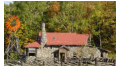
ドラマ「北の国から」ロケ地

白樺の木々にかこまれた自然豊かなチーズ工房ではガラス越しにチーズの製造室や熟成庫を見学することができます。