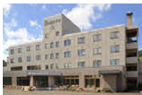
ニュー富良野ホテル