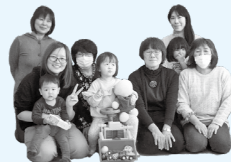
ファミサポ交流会参加のみなさん

富良野市のファミリー・サポート・センターに登録しているのは、子育ての援助をしてほしい人(依頼会員)が91人、子育てのお手伝いをする人(提供会員)が29人、援助と手伝い両方する人(両方会員)が20人です。「子育ての援助」と聞くと難しく考えがちですが、一番多いのは「習いごとの送迎」です。子育て中の人もそうでない人も、空いた時間に子育てを応援してみませんか。