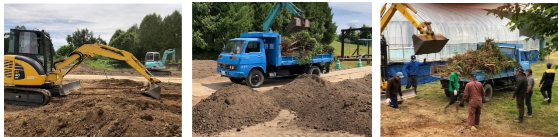
PTAによる畑づくりの様子(6/19)