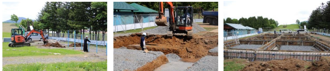
6月から始まった増築工事の様子

19日にはPTAによる畑づくりを行いました。石拾いからはじめ、トラック5台で中学校から土を運びました。ヒバの伐根作業も同時進行で行い、見晴らしの良い、広い畑が出来上がりました。秋には堆肥を入れ、次年度からかぼちゃの栽培を行う予定です。