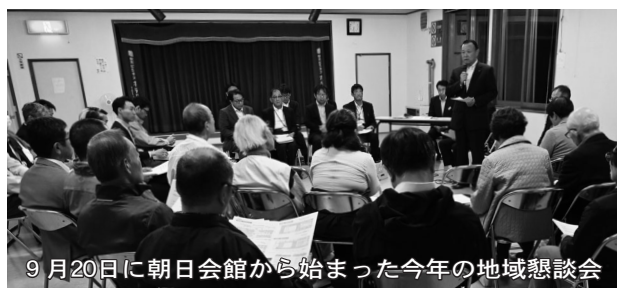
9月20日に朝日会館から始まった今年の地域懇談会