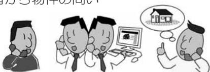
企画振興課で問い合わせを受け付け、入居希望者と物件所有者が連絡を取り合えるよう調整

企画振興課で、空き家情報を市ホームページで公開し、企画振興課で入居希望者から物件の問い合わせを受け付けます。