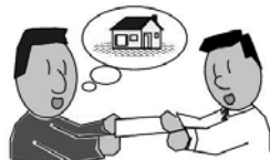
空き家情報の掲載申し込み