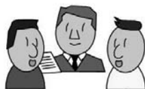
当事者間で交渉・契約協議

物件所有者と入居希望者で、交渉・契約を行います。 ※交渉や契約に際しては、企画振興課は一切関与しません。トラブルを防ぐために、宅地建物取引業協会の会員(市ホームページに掲載)に仲介してもらうことをお勧めします。