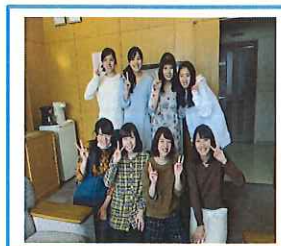
研修委員・アルバム委員