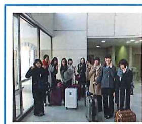
出発まで、学校ロビー前

7:55 富良野看護専門学校出発 8:00 学生寮 9:00 旭川空港 10:05発 JAL552便 → 12:00着 羽田空港 14:00~16:45 研修 東大標本室