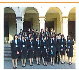
いよいよ研修開始 東大標本室前

7:55 富良野看護専門学校出発 8:00 学生寮 9:00 旭川空港 10:05発 JAL552便 → 12:00着 羽田空港 14:00~16:45 研修 東大標本室