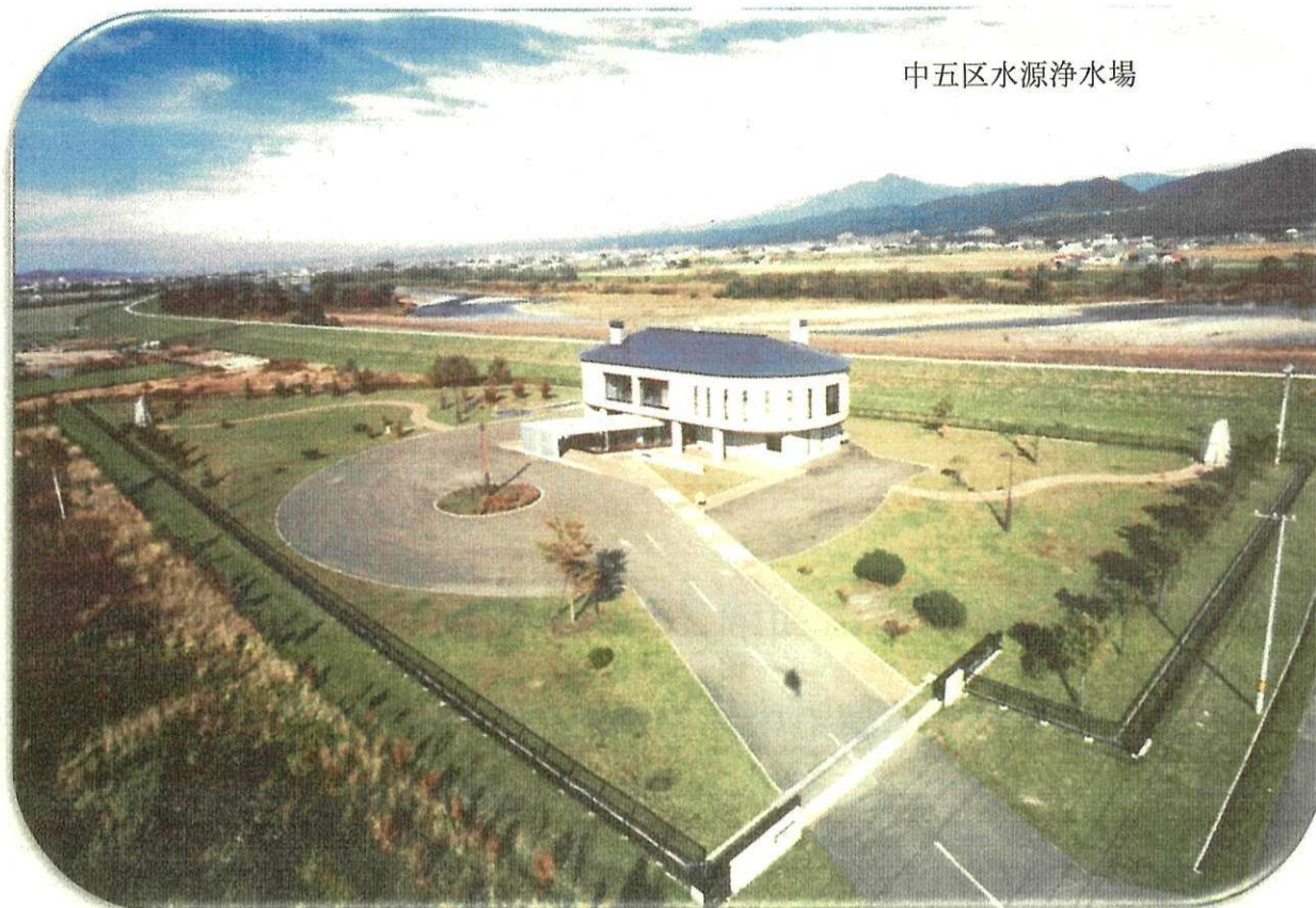
中五区水源浄水場

経営戦略の策定については、今後 10 年間の投資・財政計画を示し、収支バランスや投資事業、財源、経営健全化の取組み等を提示することとなり、総務省において「ガイドライン」が示されたことから、経営戦略策定に関し外部委託等をせず、本市の最上位計画である「第 5 次富良野市総合計画」に基づき、より具体的な戦略を策定しようとするものであります。