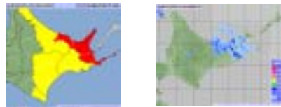
～ 雨の強さと災害の発生状況 ～