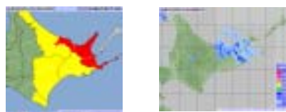
～ 雨の強さと災害の発生状況 ～