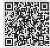
QRコード ※QRコードは株式会社デンソーウェーブの登録商標です。

②インターネットでの届出も可能です。左のウェブサイトにアドレスかQRコードからアクセスしてください。 https://www.hap.jg.jp/SksJumInWeb/EntryForm?id=FP1GzAady