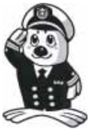
うみまる (海上保安庁イメージキャラクター)