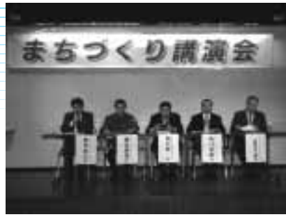
2月24日開催のまちづくり講演会では「防災とラジオ」をテーマにパネルディスカッションが行われた