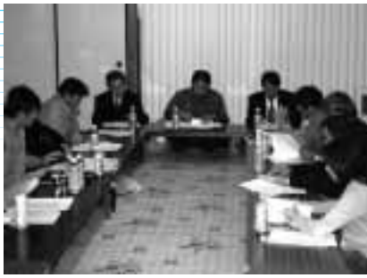
災害に備えて、東麻町第2町内会で行われた「自主防災」について学ぶ出前講座