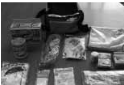
市販されている防災グッズ