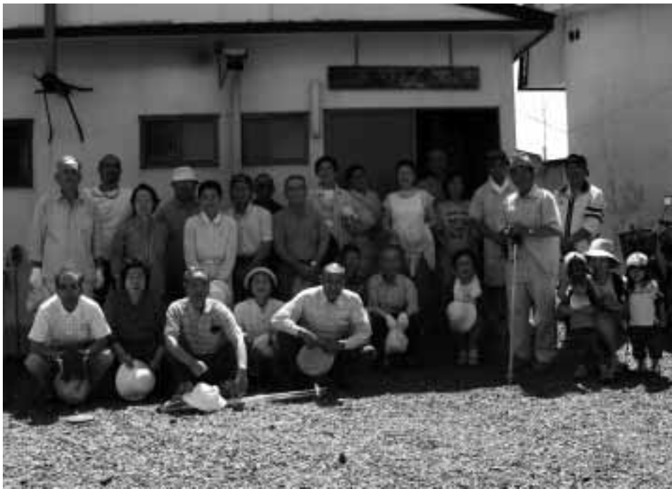
歩こう会に参加した若葉町のみなさん