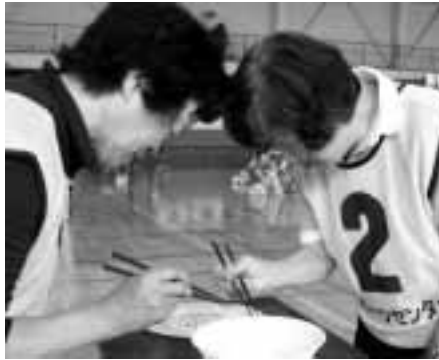
日ごろの練習の成果を発揮

健 康づくり、仲間づくりを目的としたことぶき大学3校による合同運動会が7月6日にスポーツセンターで行われ、富良野校・山部校・東山校、合わせて120人が参加しました。満水競争・リズムダンス・玉入など8種類の競技に熱戦が繰り広げられ、参加者は悪戦苦闘しながらも、心地よい汗を流していました。成績は大混戦のなか、富良野校Aが優勝しました。