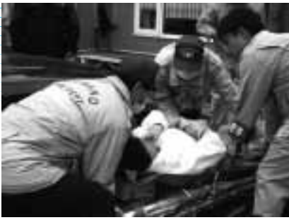
昨年9月27日に西地区コミュニティセンターで行われた防災訓練

たちが自分たちの町を守るため、防災活動を効果的に行うための組織です。自主防災組織は、大規模な災害が発生した際、地域住民が的確に行動し被害を最小限に止めるため、日ごろから地域内の安全点検や住民への防災地域の普及・啓発、防災訓練の実施など地域被害に対する備えを行います。また、実際に地震が発生したときには、初期消火活動被災者の救出・救助、情報の収集や避難所の運営といった活動を行うなど非常に重要な役割を担っています。