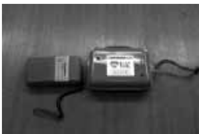
災害時情報連絡用ラジオ