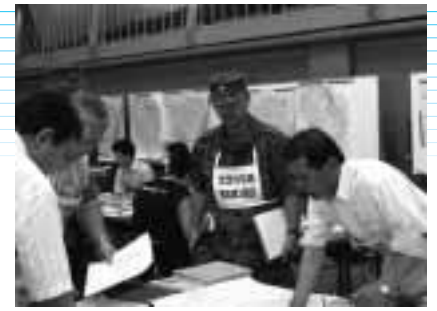
富良野市の職員も参加して行われた石狩川中流・空知川危機管理演習(7月3日、滝川市)

ています。 また、警察署や自衛隊、消防署など関係機関に協力要請を行いそれぞれの技術や労力・資材の提供などの応急活動を行う体制作りがされています。その中で自主防災組織は行政や防災機関にとって心強い重要な存在になってきます。 地域で災害に備える 自主防災組織が被害を軽減する 地震や洪水など災害が発生した場合、被害の拡大を防ぐため防災関係機関は総力をあげて防災活動に取り組みます。しかし、大規模災害は被害が広範囲に及ぶと、火災や道路の寸断などで、防災関係機関だけの活動では、被災地域に対して十分な対処ができないと考えられます。 いざというとき、各家庭がバラバラに行動しては、混乱はいつそうひどくなりまします。地域の人たちが協力し、助け合ってこそ被害の軽減に結びつきます。 自主防災組織は、地域の人