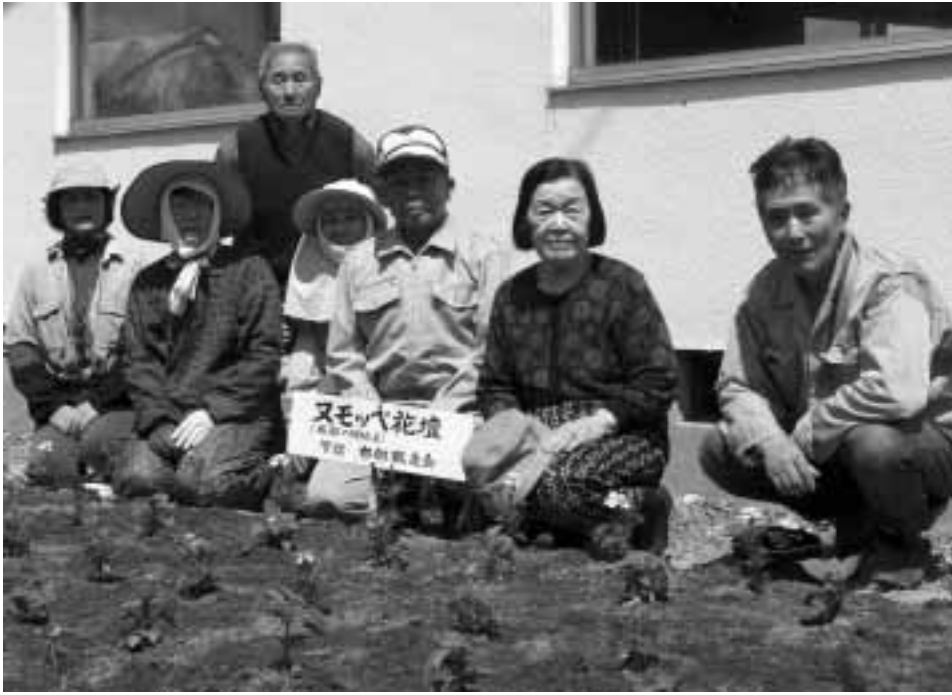
布部会館ヌモッペ花壇に花の苗を植えた布部鶴亀会のみなさん