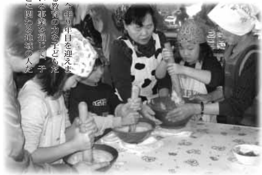
学校農園で収穫したじゃがいもを使った「イモ餅」づくりを地域の人たちに学ぶなど、楽しい交流が行われました（山部第1小学校）

平成11年からスタートした富良野市の「学社融合」事業が、今年9年目を迎えました。学校と家庭・地域が連携して、それぞれが持っている教育の力を子どもたちの教育課程の一部に取り入れたもので、数多く行われている事業を通じて、子どもたちはたくましさや生涯学習の基礎を培い、また、そこに関わる地域の人たちの生涯学習やふれあいを広げる機会にもなっています。