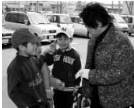
扇山小学校2年生がアサガオの種を無料配布

地 域の方とのふれあいを大切に しようと、扇山小学校の2年生 による、アサガオの種の無料配布が、 5月1日に市民生協前など4カ所で 行われました。この種は、昨年育てた もので60袋を用意。訪れた買い物客に 1袋に10粒ほど入った種と手紙を添 えてプレゼントしました。子ども達は 「色々な家庭で綺麗なアサガオを咲か せてほしい」と話してくれました。