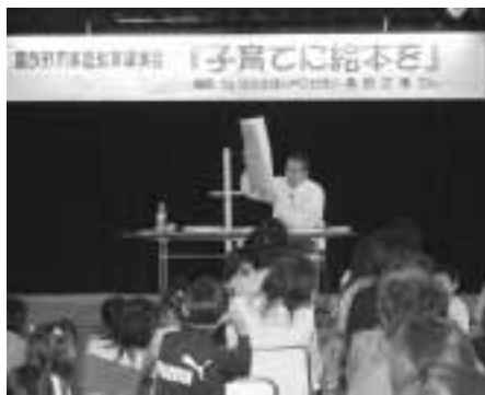
読み聞かせの魅力を紹介

地 域の方とのふれあいを大切に しようと、扇山小学校の2年生 による、アサガオの種の無料配布が、 5月1日に市民生協前など4カ所で 行われました。この種は、昨年育てた もので60袋を用意。訪れた買い物客に 1袋に10粒ほど入った種と手紙を添 えてプレゼントしました。子ども達は 「色々な家庭で綺麗なアサガオを咲か せてほしい」と話してくれました。