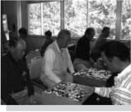
老人福祉センター図書室