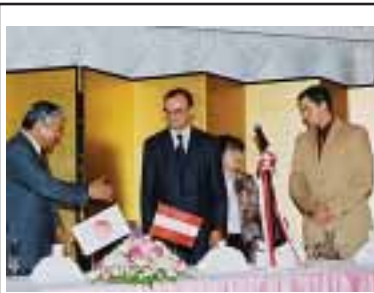
友好都市シュラートミンクの副市長と議員