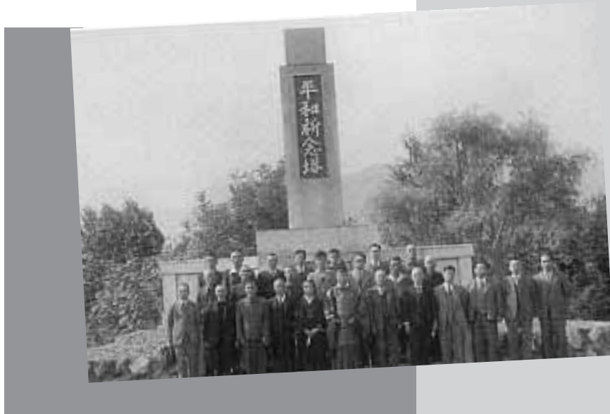
忠零塔を平和記念塔に改め慰霊祭を行う（昭和22年）