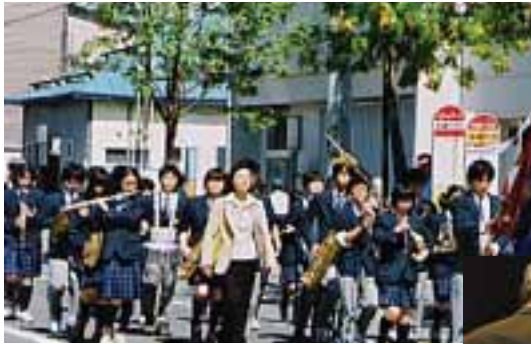
音楽パレード：市内各小中学校のパレード