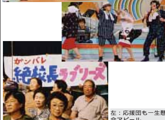
左：応援団も一生懸命アピール