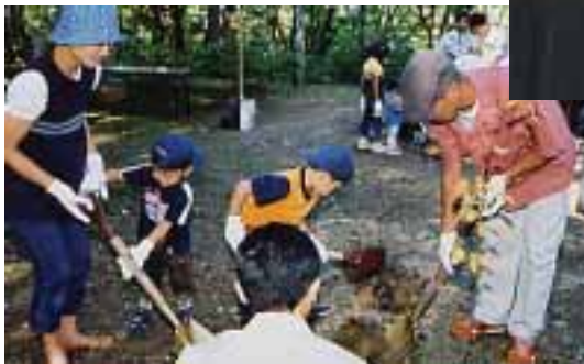
植樹際：市民が参加して記念植樹