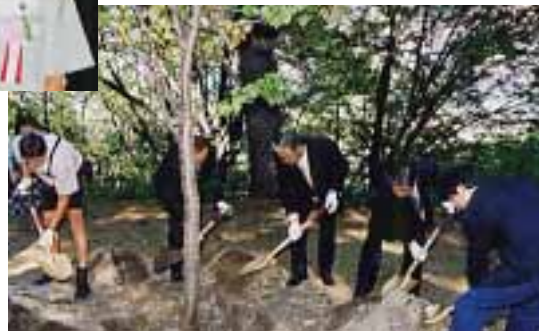
植樹際：友好都市シュラートミンクの副市長・議員との記念植樹