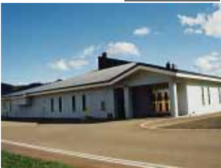
汚泥再生処理センター