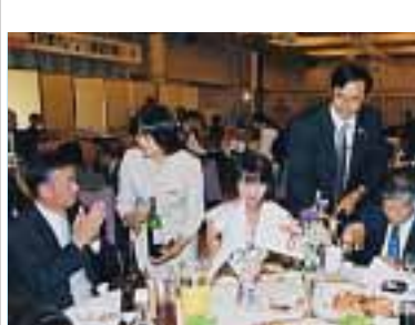
歓迎会を楽しむ人たち