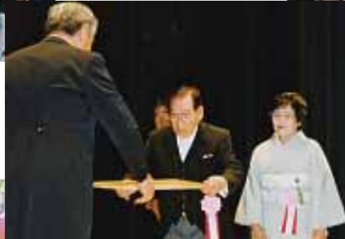
記念式典： 市政に功績のあった 98名と1団体を表彰