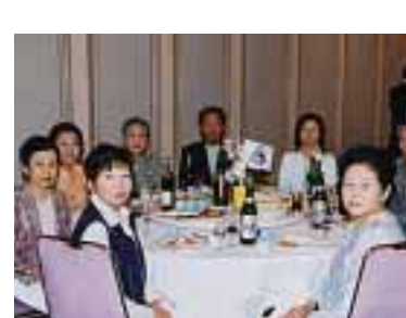
友好都市25周年で富良野市を訪れた西脇市民ツアー一行