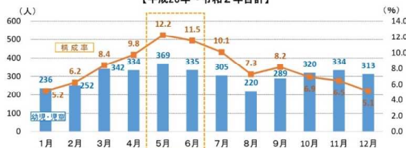
歩行中の幼児（就園児・未就園児）・児童（小学生）の死者・重傷者数の月別推移 【平成28年～令和2年合計】