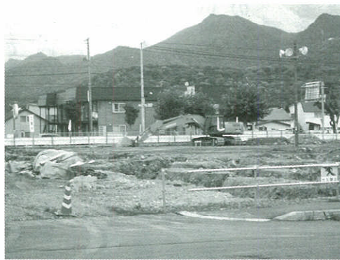
フラノ・マルシェ工事始まる

問 ふらのまちづくり株式会社が行うこの計画と当初の基本計画との違い、市民周知、市民意見の聴取について。地代、その他整備の考えについて。市は開発の保証人になるのか。