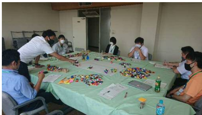
第1回庁内推進PT会議(大人未来づくりフォーラム)