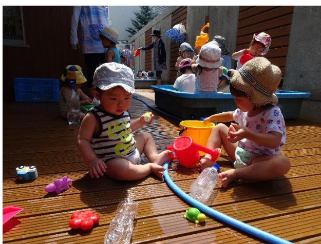
♪のお姉さんが遊んでくれました♪