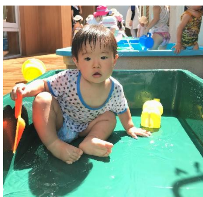
水がなくなっても…「まだあそぶ～」