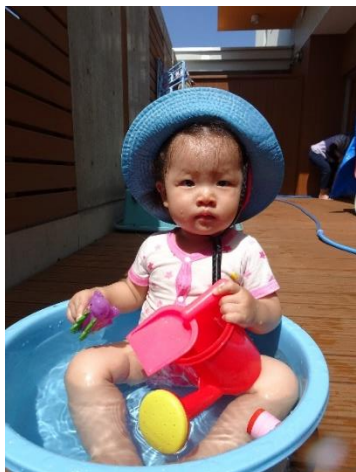
タライに入っている気持ち😊