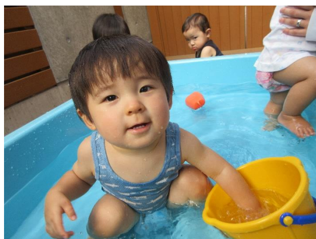
「冷たくて気持ちいいよー」