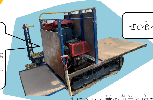
↑ほうれん草の根元を切る機械