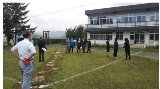
〈8月5日 現地視察の様子〉