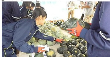
②1個ずつ拭いて土を落として…