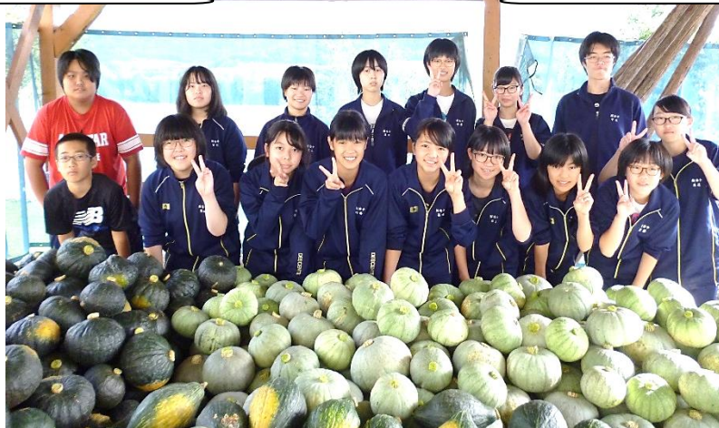
樹海中学校のみなさん