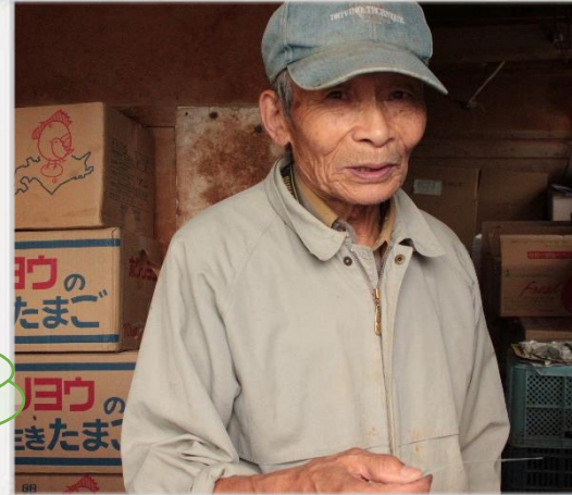
おおにしのうえん さん