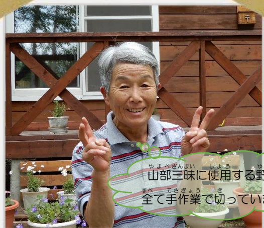
ゆうふれのさと さん