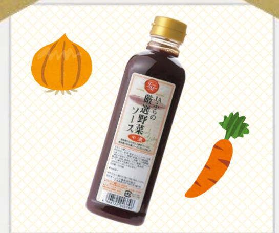
JA ぶらの さん

ぶらのし、なかぶらのちょう、しむかっぷむら ◇げんせんやさいソース【オムカレー】