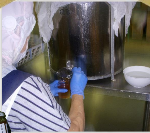
しむかっぷさんさんさんぎょう