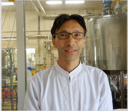
のうさんこうしゃ さん