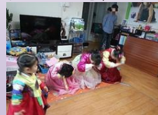
韓国では年上の人をととても敬います