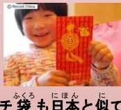
ポチ袋も日本と似ていますね