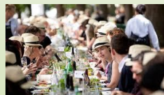
Wine Festival in Sydney