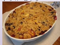
Apple & Black Berry Crumble