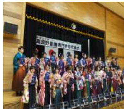
準備はいいですか？