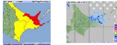
～ 雨の強さと災害の発生状況 ～