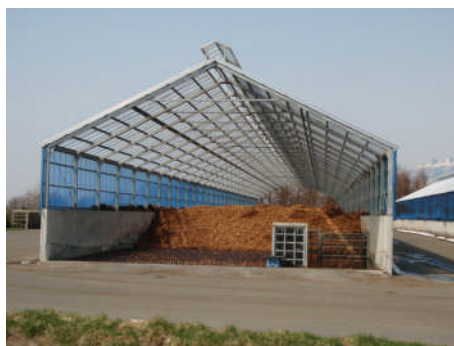
堆肥に変わる野菜残渣