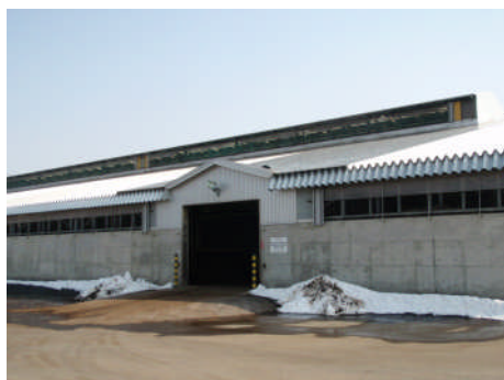
既存の堆肥製造センター